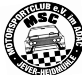
Stempel des Veranstalters